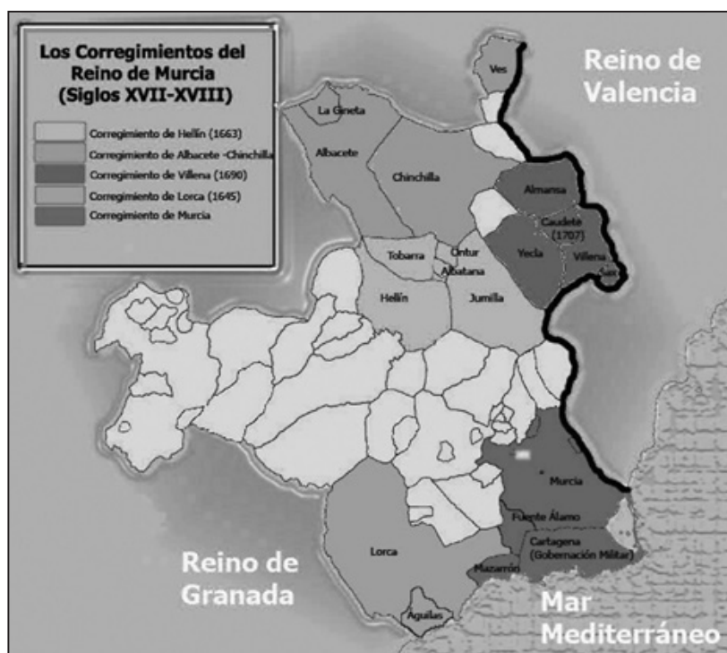
Los Corregimientos del Reino de Murcia (siglos XVII-XVIII).