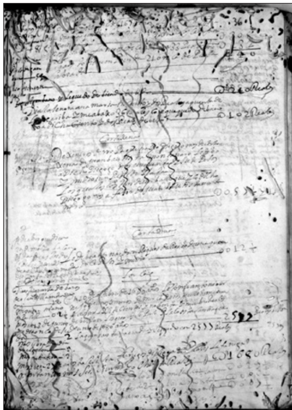
Página 1 del libro de contabilidad, con anotaciones de Cartagena y Lorca.