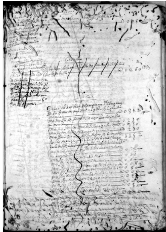
Página 3, en la que abajo está sin tachar un contrato hecho mediante anotación en el libro.